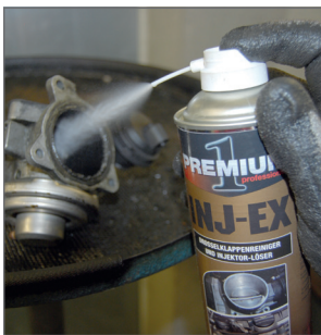
INJ-EX důkladně čistí ventily EGR a volnoběžné ventily.