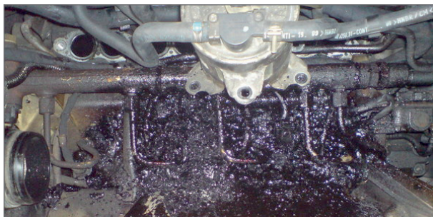
Řeší problémy s vypálenými a zuhelnatělými vstřikovači nafty.